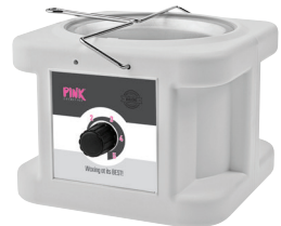
PINK PROFESSIONAL WAX HEATER 1000 ML