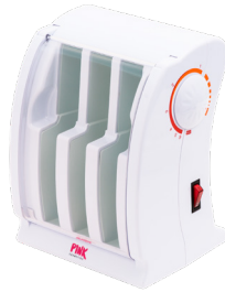
PINK PROFESSIONAL TRIPLE ROLL-ON WAX HEATER