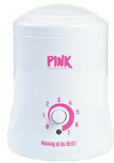
PINK PROFESSIONAL WAX HEATER 200 ML