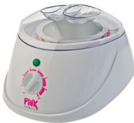
PINK PROFESSIONAL WAX HEATER 450 ML