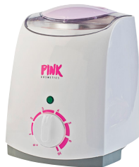
PINK PROFESSIONAL WAX HEATER 800 ML